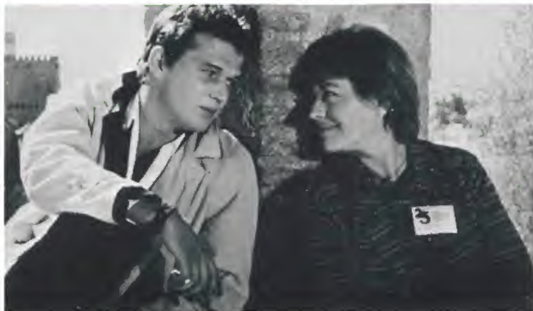
Laurent Malet - Annie Girardot